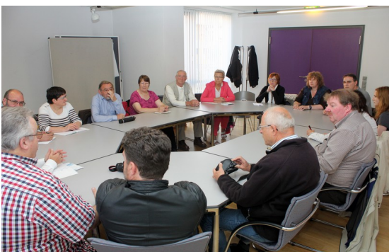
Réunion des 2 comités

Le samedi, d'abord réunion à 9h des 2 comités de jumelage à la mairie. Puis rendez-vous à 9h45 pour aller prendre le petit déjeuner à la Kälberhalle (les anciens abattoirs convertis en brasserie et restaurant) à Augsburg composé de 2 saucisses blanches et d'un gros bretzel bien chaud arrosés d'une bière de préférence (Hasen Bier). Vers midi nous reprenons les autocars pour aller visiter le TIM (le musée du textile). Nous avons pu voir quelques machines de tissage notamment le jacquard) en fonctionnement pendant quelques minutes. Devant le musée se trouve un tank recouvert de tissus de toutes les couleurs symbolisant la paix dans le monde.