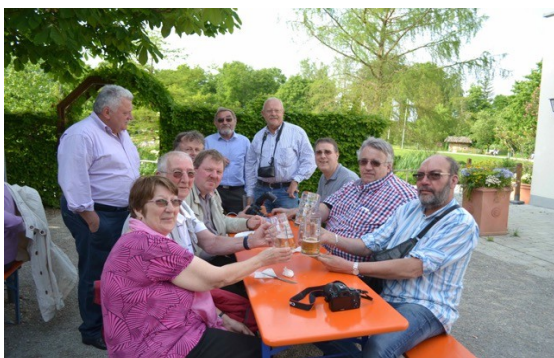
Boire un petit coup... zum Wohl

A 19h30 nous étions attendus au restaurant Strasser situé près de l'hôtel de ville de Gersthofen et qui a ré-ouvert ses portes justement ce jour là. Avant de commencer le dîner notre président a remis nos cadeaux aux membres du Verein Nogent-Gersthofen qui ont participé à l'organisation de notre séjour. Il s'agissait d'un verre gravé commémorant le 45 e anniversaire de notre jumelage.