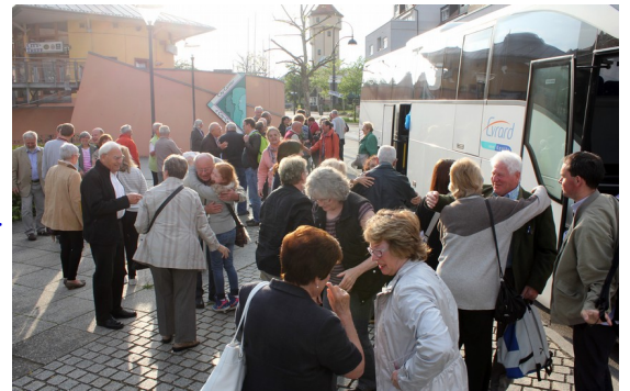
L'arrivée à Gersthofen

La première journée s'est passée en famille. Les uns ont visité le musée Audi à Ingolstadt ; pour ma part j'ai visité la cathédrale d'Ausburg et 2 églises dont la St Moritz dépouillée de toute trace baroque; les murs sont totalement blancs ainsi que les vitraux; seul le Christ debout derrière l'autel semble sortir du désert et nous adressant un signe de bienvenue. C'est de la 3D ! Après un petit tour à l'Office de Tourisme, nous avons pris la route pour Ammersee : un superbe lac (le 3 e d'Allemagne en superficie) au bord duquel se tenait un marché international de céramiques. Beaux objets à des prix ... en rapport.