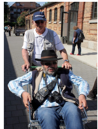
Avait-il bu trop de bière ?

Ensuite nous avons filé au jardin botanique où chacun a pu se promener à sa cadence et s'arrêter boire un verre ou manger une glace. J'ai bien aimé les hôtels à insectes au milieu des fleurs, le jardin japonais et surprise un jardin de plantes toxiques. Tout est bien expliqué et il vaut mieux savoir