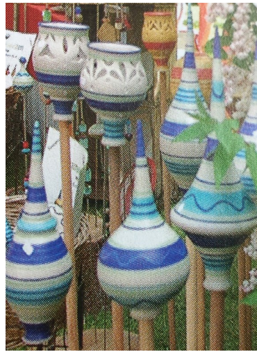
Journée en famille: Marché aux céramiques