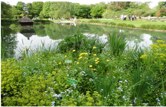
Le Jardin botanique

les reconnaître. Enfin nous avons visité la brasserie Riegele où nous avons bénéficié d'explications avec moult détails ; nous proposons cette bière depuis bien des années dans nos différentes manifestations notamment le forum des associations.