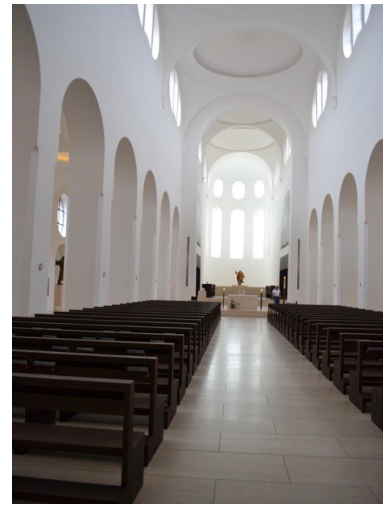
Journée en famille: Eglise St Moritz

Le soir nous nous retrouvons tous au « lokal » du club de curling pour une grillades party et dégustation de gâteaux faits maison. On se retrouve, on bavarde, on demande des nouvelles des uns et des autres et on en donne. C'était très convivial !