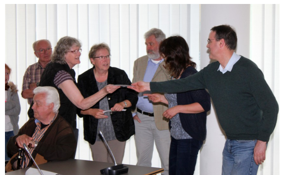
Attribution des hôtes