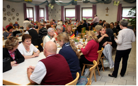
Au « lokal » du club de Curling

Le samedi, d'abord réunion à 9h des 2 comités de jumelage à la mairie. Puis rendez-vous à 9h45 pour aller prendre le petit déjeuner à la Kälberhalle (les anciens abattoirs convertis en brasserie et restaurant) à Augsburg composé de 2 saucisses blanches et d'un gros bretzel bien chaud arrosés d'une bière de préférence (Hasen Bier). Vers midi nous reprenons les autocars pour aller visiter le TIM (le musée du textile). Nous avons pu voir quelques machines de tissage notamment le jacquard) en fonctionnement pendant quelques minutes. Devant le musée se trouve un tank recouvert de tissus de toutes les couleurs symbolisant la paix dans le monde.