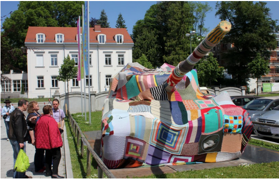
Le Tank de la paix au TIM