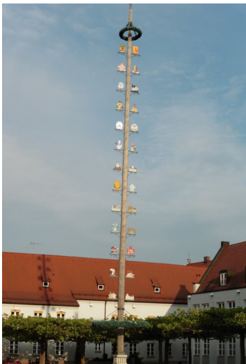
L'arbre de mai