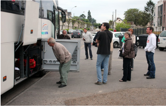
Tout est bien chargé ?