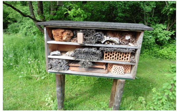
Hôtel à insectes, jardin botanique

A 19h30 nous étions attendus au restaurant Strasser situé près de l'hôtel de ville de Gersthofen et qui a ré-ouvert ses portes justement ce jour là. Avant de commencer le dîner notre président a remis nos cadeaux aux membres du Verein Nogent-Gersthofen qui ont participé à l'organisation de notre séjour. Il s'agissait d'un verre gravé commémorant le 45 e anniversaire de notre jumelage.