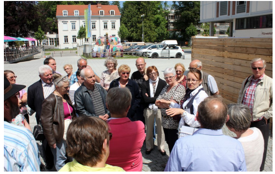
Avec notre guide au TIM

les reconnaître. Enfin nous avons visité la brasserie Riegele où nous avons bénéficié d'explications avec moult détails ; nous proposons cette bière depuis bien des années dans nos différentes manifestations notamment le forum des associations.