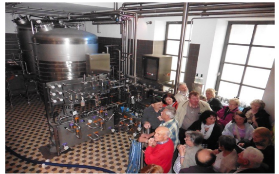
A la brasserie Riegele

Enfin, le dimanche à 8h30 nous avons un dernier rendez-vous sur la place des fêtes pour un retour vers Nogent à 9h ; il nous fallait bien 30 minutes pour prendre congé de nos hôtes ; moment toujours empreint d'émotions !