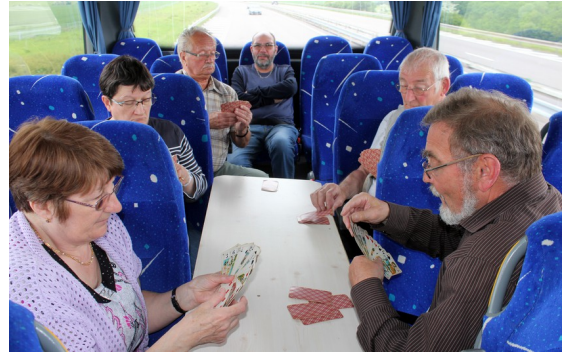
Ambiance dans le car