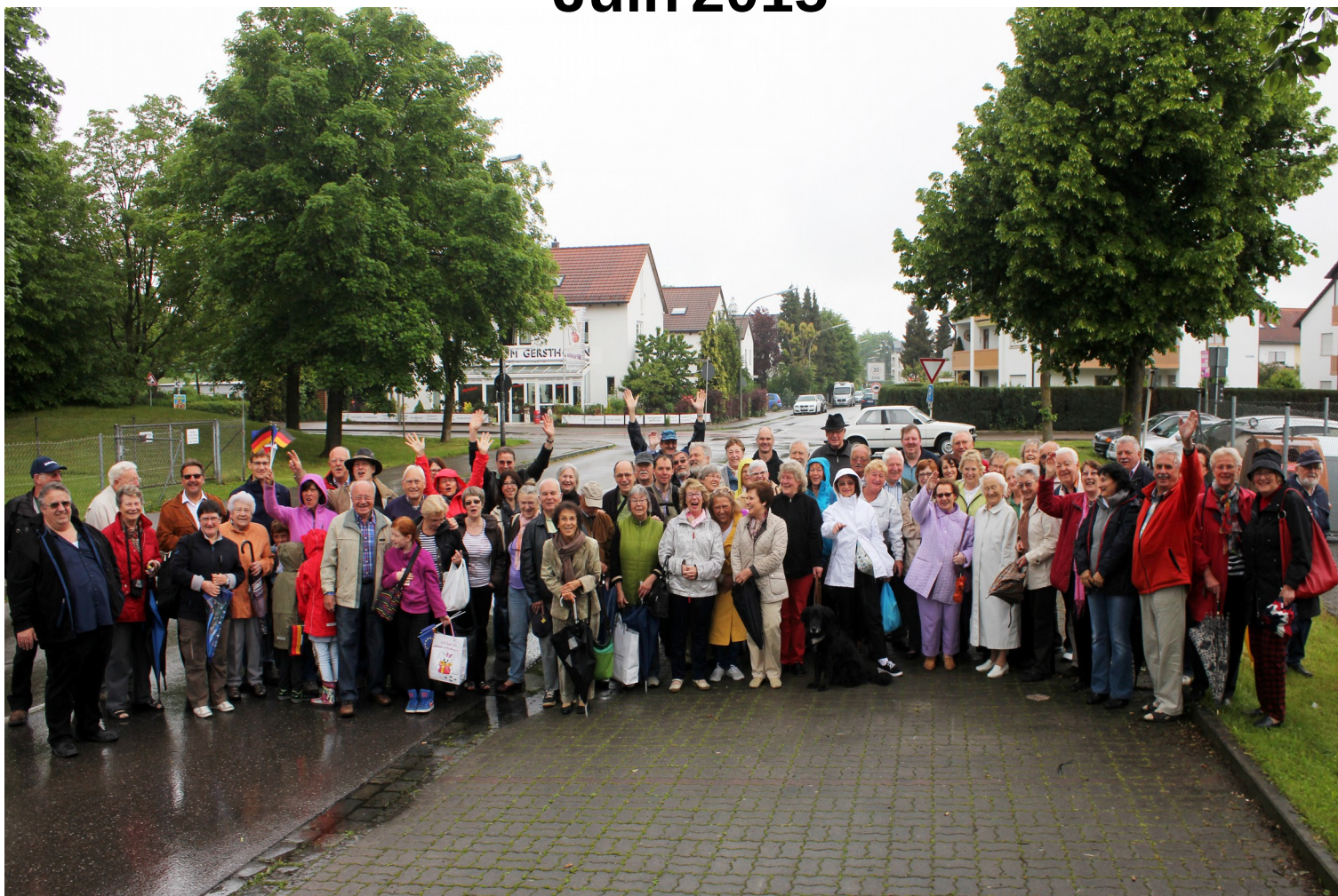
Les Nogentais à Gersthofen, mai 2015