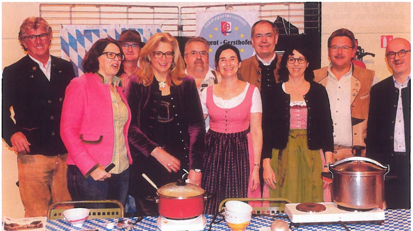
Stand de notre association au Bal de la soupe en compagnie de la délégation des Gersthofen