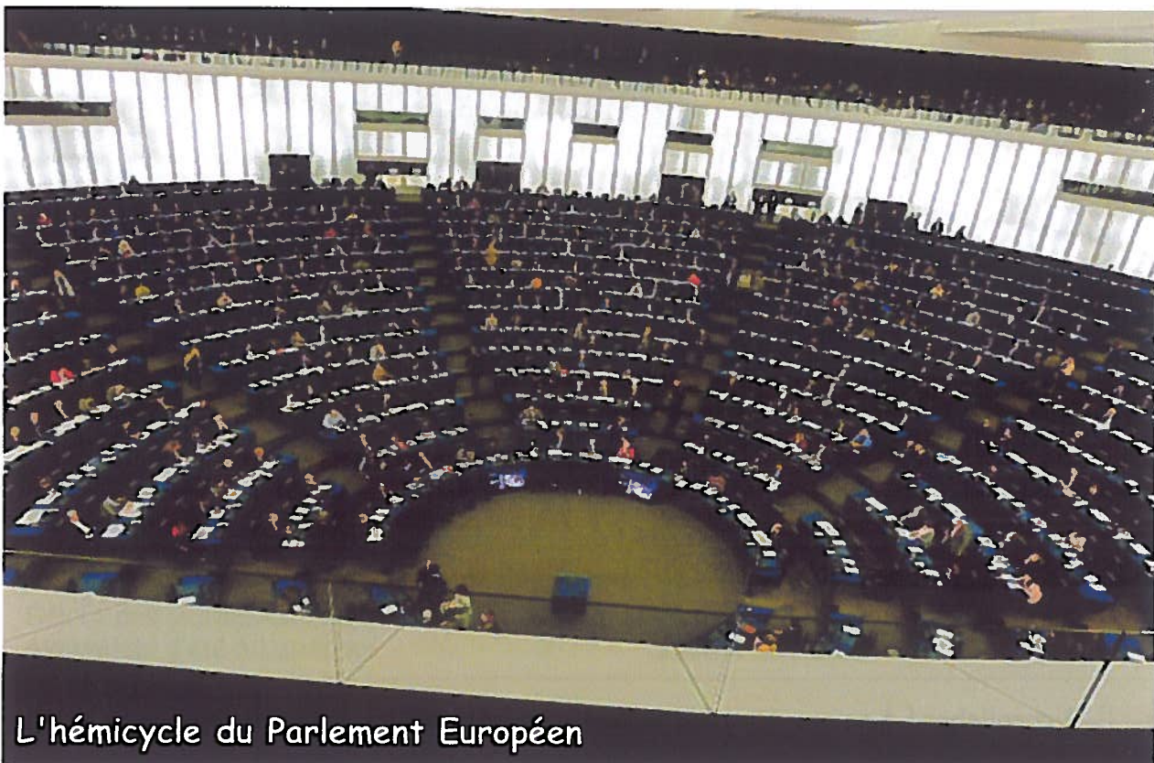
L'hémicycle du Parlement Européen