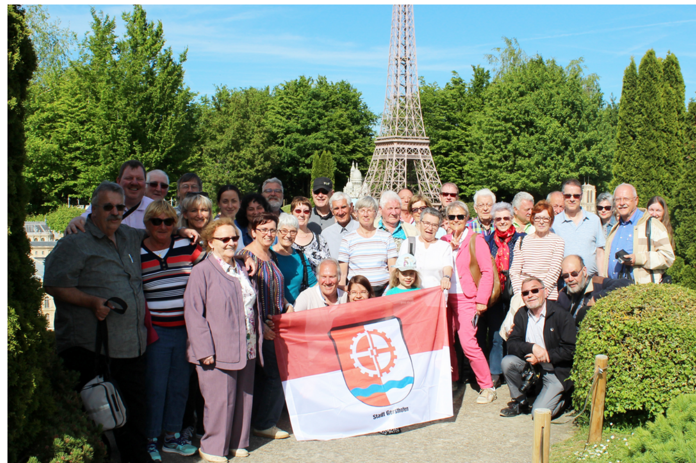
Arrivée du tour de France...